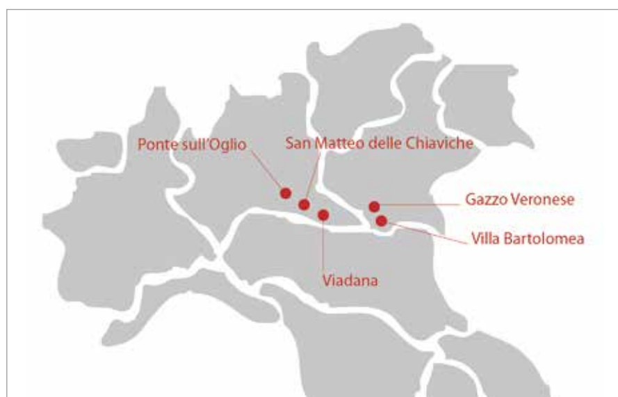
Figura 1 - Distribuzione geografica delle piantagioni policicliche con 'I-214' in cui sono stati rilevati i dati utilizzati in questo studio.